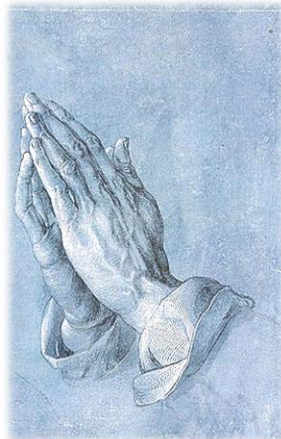
Betende Hände – Albrecht Dürer 1471 – 1528

So darf ich Ihnen und mir frohe Ostern wünschen.